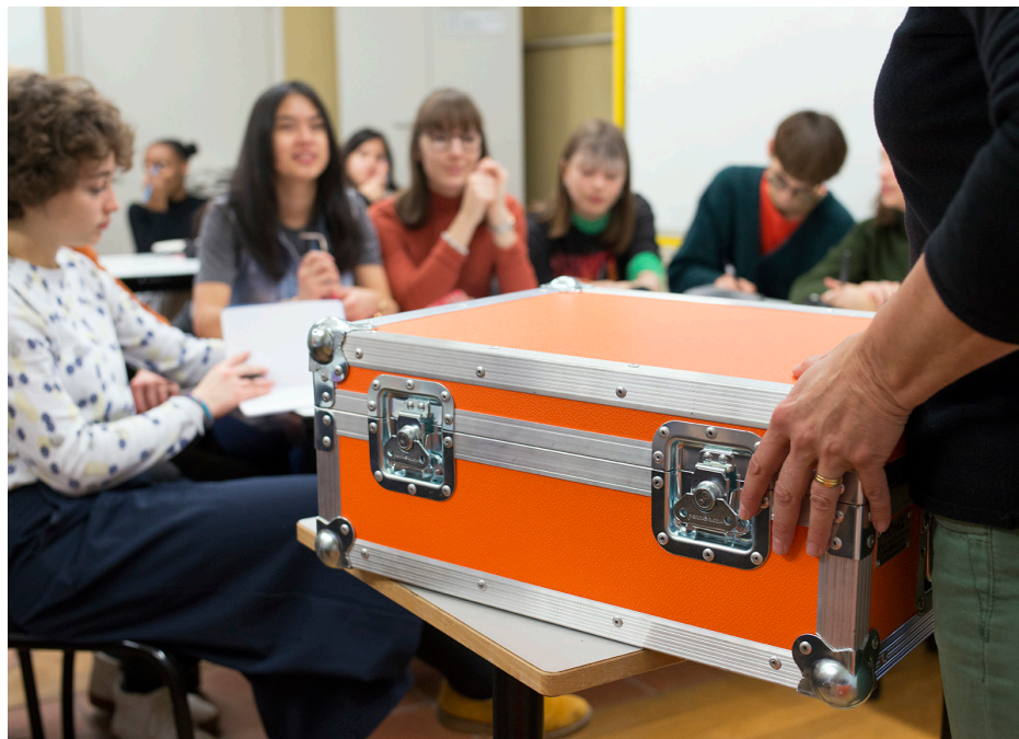
La Mallette #1, Frédéric Lefever © Frac Franche-Comté. Photo : Nicolas Waltefaugle